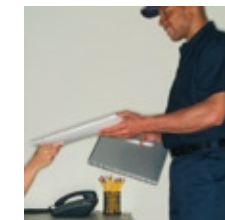
Transport de la tête dans son cryokit