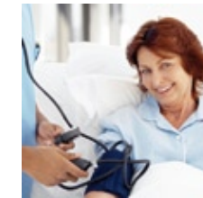
Selection du donneur