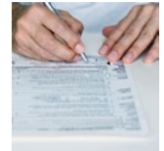
Consentement du donneur Renseignements cliniques