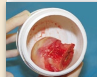
+ Tubes pour sérologie/sérothèque + Prélèvement microbiologique